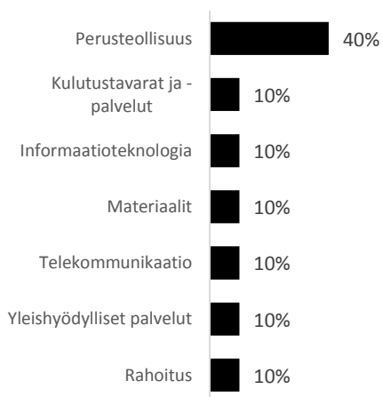
Kuva 2. Kohdemarkkinan painojakauma 16.8.2018