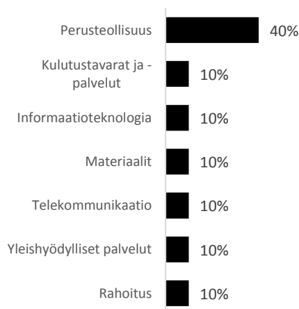
Kuva 2. Kohdemarkkinan painojakauma 31.10.2018