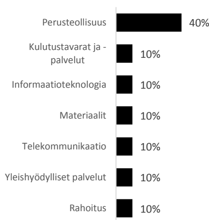
Kuva 3. Kohdemarkkinan toimialajakauma 31.10.2018 (Lähde: Bloomberg).

ABB Ltd on sähkövoima- ja automaatioteknologia-yhtiö, jonka osakkeella käydään kauppaa Zürichin, Tukholman ja New Yorkin pörssissä. ABB on maailman johtava teollisuuden moottorien ja taajuusmuuttajien tuuliturbiinigeneraattoreiden sekä sähköverkkoyhtiöiden toimittaja. ABB:n palveluksessa on globaalisti yli 140 000 henkilöä.