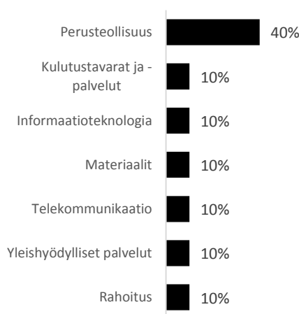
Kuva 3. Kohdemarkkinan toimialajakauma 16.8.2018 (Lähde: Bloomberg).

ABB Ltd on sähkövoima- ja automaatioteknologia-yhtymä, jonka osakkeella käydään kauppaa Zürichin, Tukholman ja New Yorkin pörssissä. ABB on maailman johtava teollisuuden moottorien ja taajuusmuuttajien tuuliturbiinigeneraattoreiden sekä sähköverkkojen toimittaja. ABB:n palveluksessa on globaalisti yli 140 000 henkilöä.