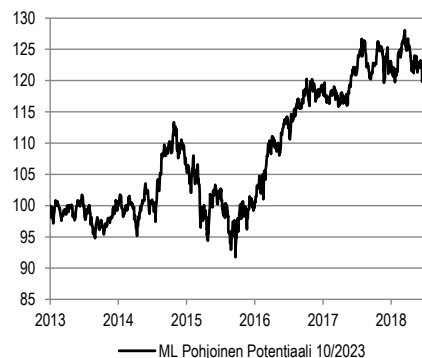
Kuva 1. Kohdemarkkinan indeksoitu arvonkehitys 16.8.2013 – 16.8.2018 (16.8.2013 = 100). Kohdemarkkinan tuotot on laskettu paikallisvaluutoissa. Historiallinen tuotto ei ole tae tulevasta tuotosta.

Euroopan ja koko maailmantalouden hyvä kehitys valaa uskoa myös pohjoismaalaisen osakemarkkinan positiiviseen kehitykseen.