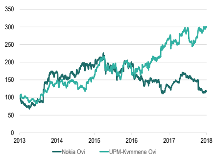
Kuva 1. Nokian ja UPM:n osakkeiden indeksoitu arvonkehitys 15.1.2013 – 15.1.2018 (15.1.2013 =100).

Yhtiöiden osakekurssit ovat menneet viimeisen vuoden aikana vahvasti eri suuntiin.