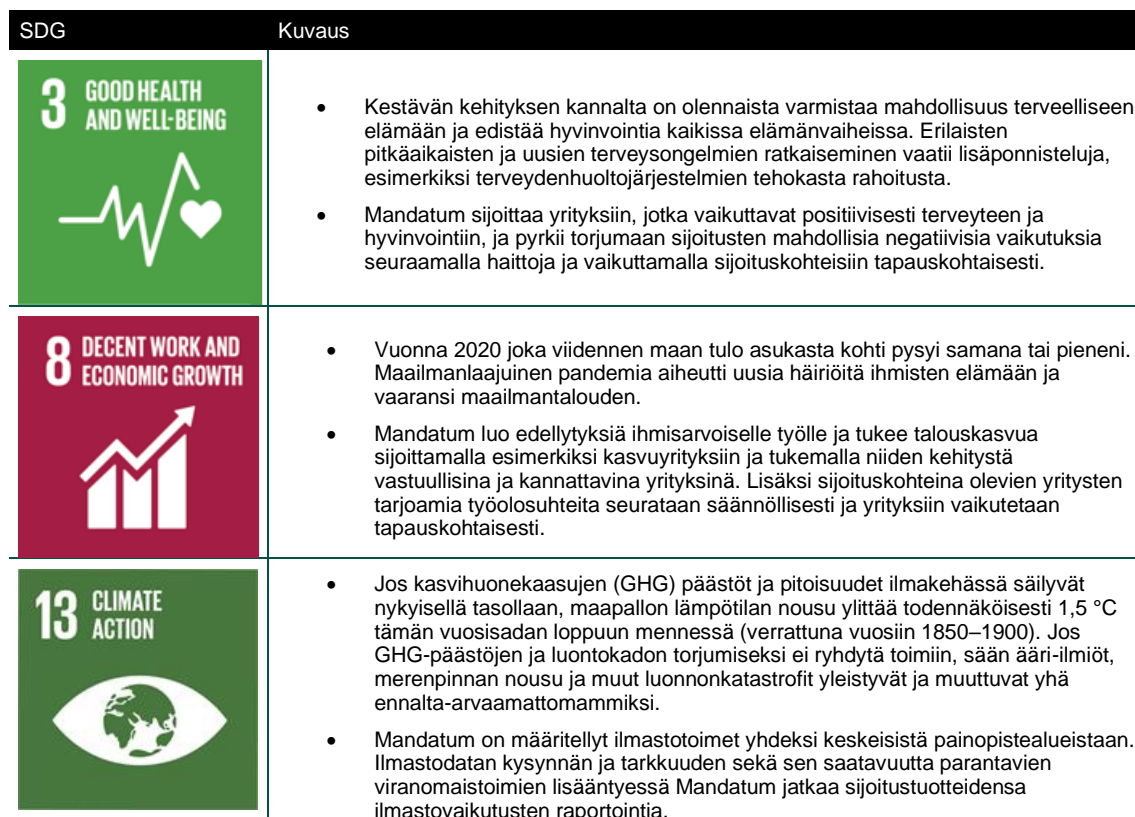
Taulukko 1. YK:n kestävästä kehityksen tavoitteet ja kuvaukset.

Mandatum tiedostaa YK:n kestävästä kehityksen tavoitteiden (SDG) tärkeyden sijoitusprosessin ohjaamisessa. Mandatum-konserni on määrittellyt seuraavat kestävästä kehityksen tavoitteet toimintansa kannalta tärkeimmiksi. Mandatumin salkunhoidon tavoitteena on vaikuttaa positiivisesti näihin tavoitteisiin (tarkempi kuvaus taulukossa 1).